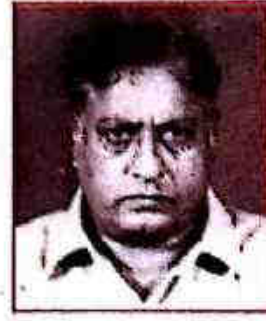
मा. डी. वार, श्रीनीरीवार